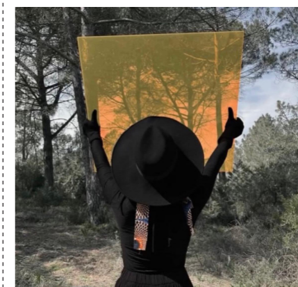
imagem 5. imagem adaptada do vídeo Soba Eternal, 2023, Banga Coletivo