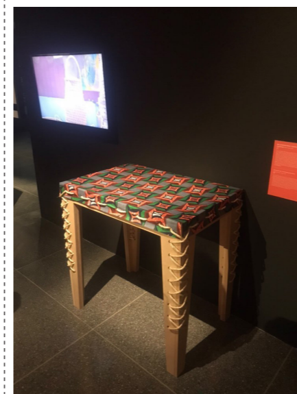
imagem 3. instalação banco e bancada e projeção de curta-metragem Oku Tumala Oku Tekula, 2022, Pedro Vada